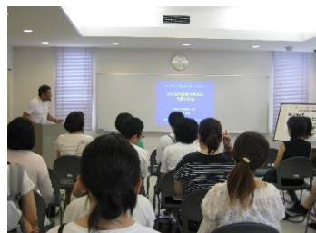
8/2 子どもの病気と事故防止