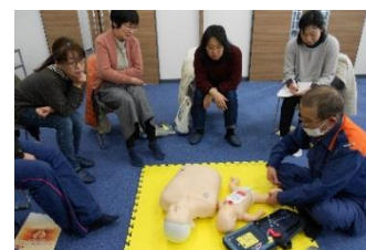
2/26 救急救命講習会 次回も2月ごろに開催予定