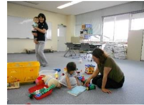
講習会での託児のようす

曜日限定や空いた時間にあわせて活動できますので、 できるかも？と思われる方はぜひ申し込んでください。