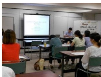
7/18 心の発達と関わり方