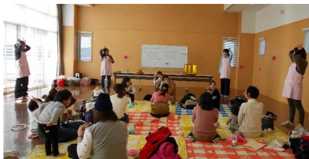
3/2 ファミサポ交流会 「ひなパーティ」