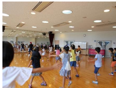
キッズダンスコース 軽快なJポップに合わせて、 とても上手なダンスでした。