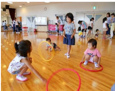
親子体操コース ボールやフープで遊んだよ。

ファミサポでは、両方会員でもあるサブリーダーさんに企画運営をお願いして、親子で楽しめる交流会を開催しています。