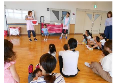
サブリーダーさんとクイズ で楽しく遊びました。